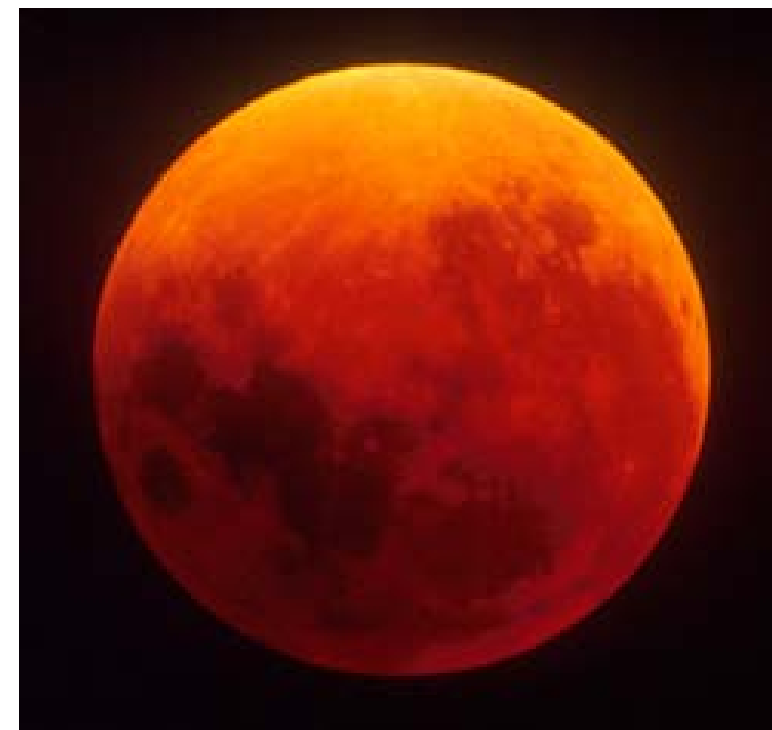
4:48:05 TU, 30sec, F.1000/f.10, Dia.100 ASA, Kodak

Memore comunque di un'altra stupenda eclissi vissuta a Medelana qualche anno fa, vinciamo il sonno, rimandiamo gli impegni e ci si trova sul campo. L'eclissi non ha deluso le nostre aspettative, il cielo era limpido e sgombero da nubi, il fenomeno inizia, e ci prepariamo per fotografarlo equipaggiati con vari strumenti portatili. Mentre scattiamo però attendiamo la fase totale che è anche la più interessante.